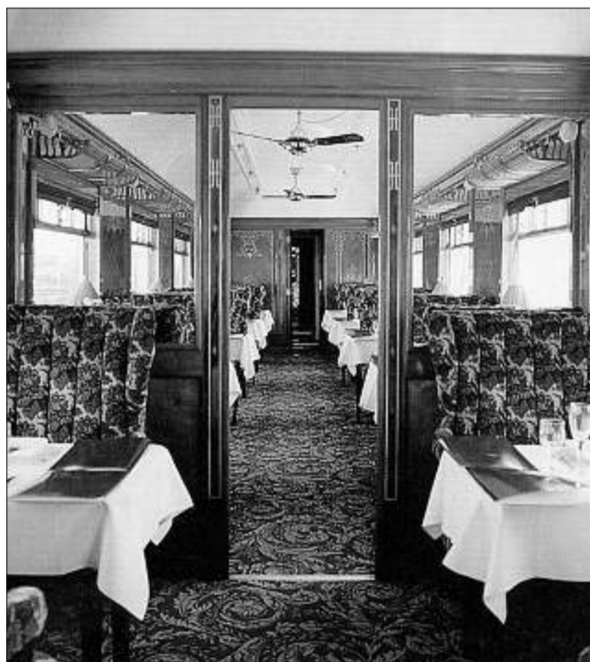
Il vagun-restaurant da l'Orient-Express Nr. 4080, Flèche d'Or.

tunnel dal Simplon, è vegnida inaugurada la varianta meridionala da l'Orient-Express Simplon. Il tren traversava la Svizra via Losanna e Brig, per part era via Berna e Brig, per la fin finala arrivava a l'ost via Milaun, Venezia e Belgrad.