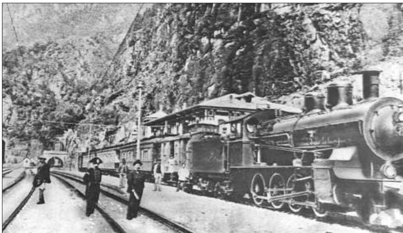
L'Orient-Express al Simplon enturn 1906.